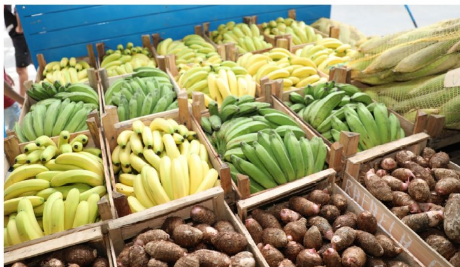
Por: Vandique Magalhães

Na manhã desta quarta-feira (3), quase 17 toneladas de produtos agrícolas foram descarregadas no Banco de Alimentos por 31 pequenos produtores rurais da agricultura familiar de Cariacica. Agora, os produtos serão separados para compor a cesta verde para instituições filantrópicas e famílias em vulnerabilidade.